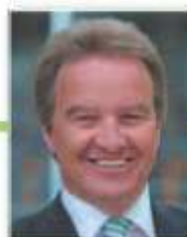
Franz Untersteller MdB, Minister für Umwelt, Klima u. Energiewirtschaft