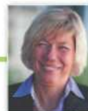
Sylvia Pilarsky- Grosch Vizepräsidentin des Bundesverbandes WindEnergie e.V.